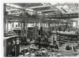
Immagine del capannone adibito all'assemblaggio delle locomotive della Schweizerische Lokomotive- und Maschinenfabrik (SLM) di Winterthur, 1900 ca.