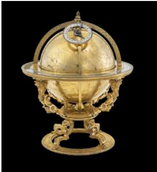
Globe céleste fabriqué par Jost Bürgi, 1594. Laiton doré

Le grand érudit Jost Bürgi (1552–1632) était horloger à la cour du landgrave de Cassel Guillaume IV, qui réunissait autour de lui des mathématiciens et des astronomes célèbres. Ce globe céleste, dont la réalisation technique et artistique est remarquable, est l'un des cinq exemplaires de Jost Bürgi conservés.