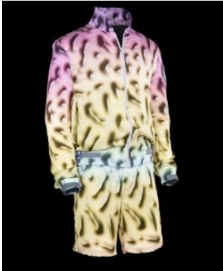
Ensemble de Julian Zigerli (*1984). Short et veste appartenant à la collection « My Daddy was a military pilot ». 2013. Soie imprimée

Son nom est synonyme de design rafraîchissant et techniquement abouti. Ses créations sont caractérisées par des motifs imprimés qu'il développe avec des artistes, des graphistes et des photographes. Zigerli a reçu le Prix suisse du design pour la collection à laquelle appartient cet ensemble.