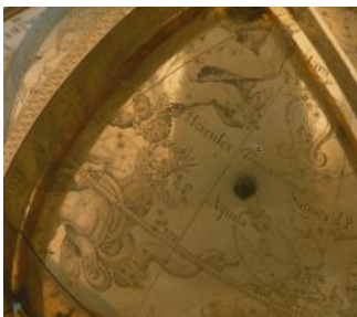
Globe céleste fabriqué par Jost Bürgi, 1594. Détail