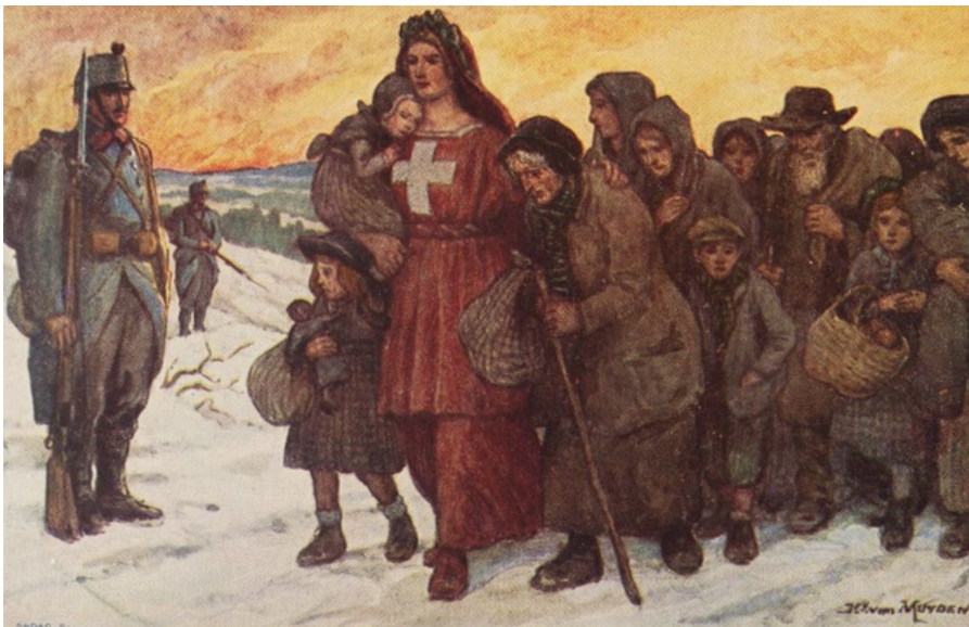
Druckgrafik. Motiv der Bundesfeier-Postkarte von 1915: Helvetia führt eine Gruppe von Flüchtlingen durch den Schnee, an Soldaten vorbei. Charles Henri van Muyden. 1915.