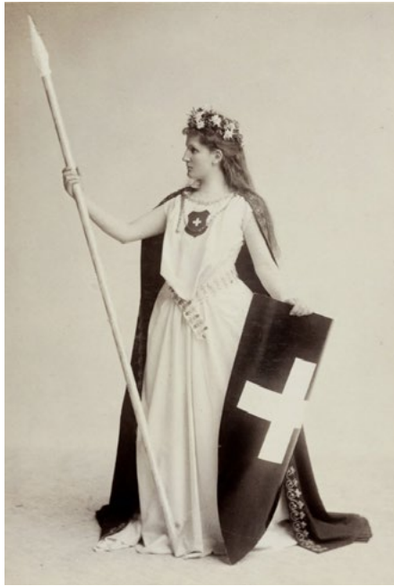
Fotografie. Helvetia mit Lanze, Blumen in den Haaren und Schild mit Schweizerwappen. Johannes Meiner. 1896.