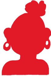
Freundin oder Freund?