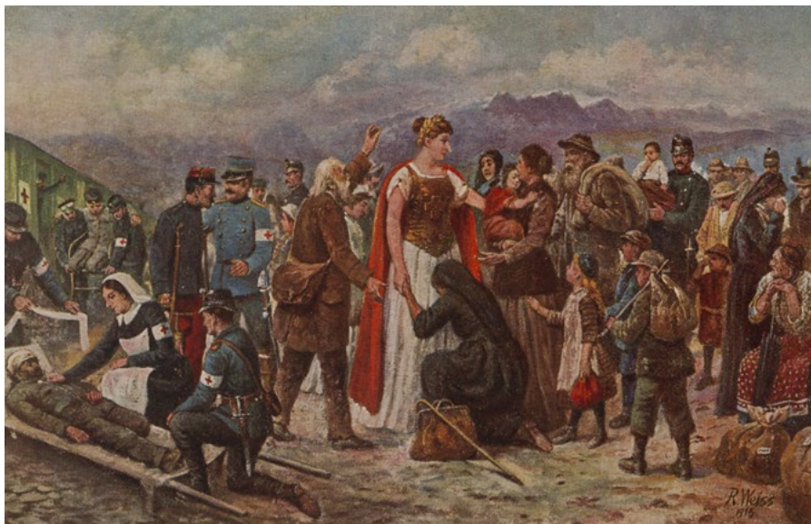
Postkarte. Die hilfreiche Helvetia. Soldatenszene Aktivdienst 1914–1918. Richard Salomon Weiss. 1915.