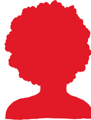
Profisportlerin oder -sportler?