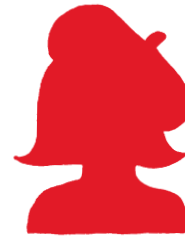
Musikerin oder Musiker?