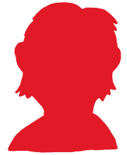
Influencerin oder Influencer?